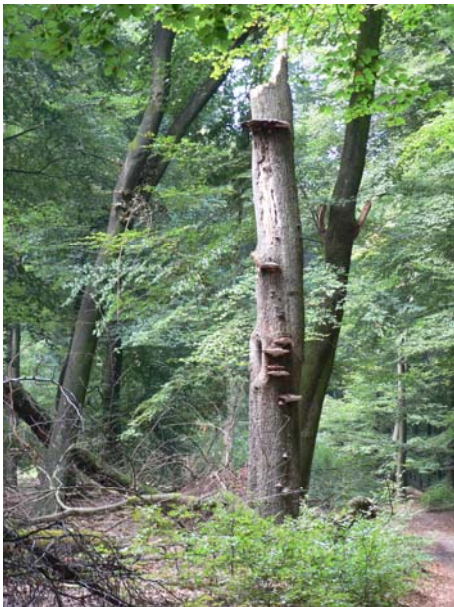
Dode beuk met Thonderzwammen.

Al het materiaal komt dus weer terug in de bodem en zo is de kringloop van het bosecosysteem rond. In bossen met dood hout is de biodiversiteit veel hoger. Dood hout draagt bij aan belangrijke ecologische processen. Veel soorten zijn volledig afhankelijk van dood hout, zoals het vliegend hert. Deze grote kever komt in Nederland alleen nog voor op de Veluwe.