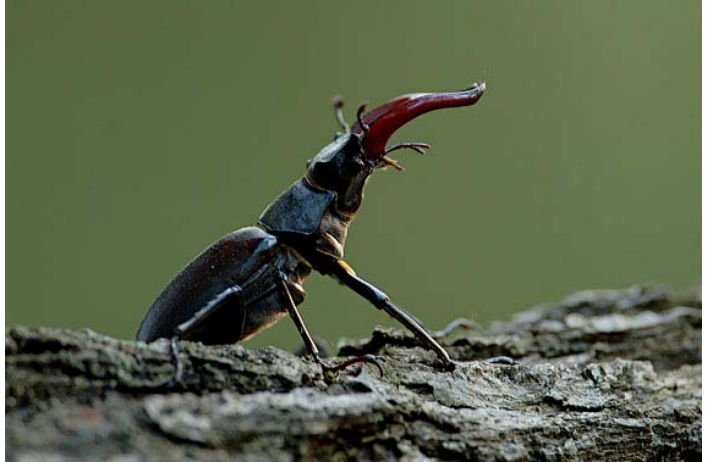
Vliegend hert.

Voor een bos heeft dood hout een grote natuurwaarde. Dode bomen, zowel dikke als dunne, zijn onmisbaar. Paddenstoelen, mossen en insecten, vogels en zoogdieren profiteren allemaal van dood hout. Vandaar het gezegde “dood hout leeft”. Het biedt beschutting, woonruimte, voedsel en vocht. Ook geeft liggend dood hout vocht en voeding af aan de bodem, wat gunstig is voor de kieming van diverse plantensoorten.