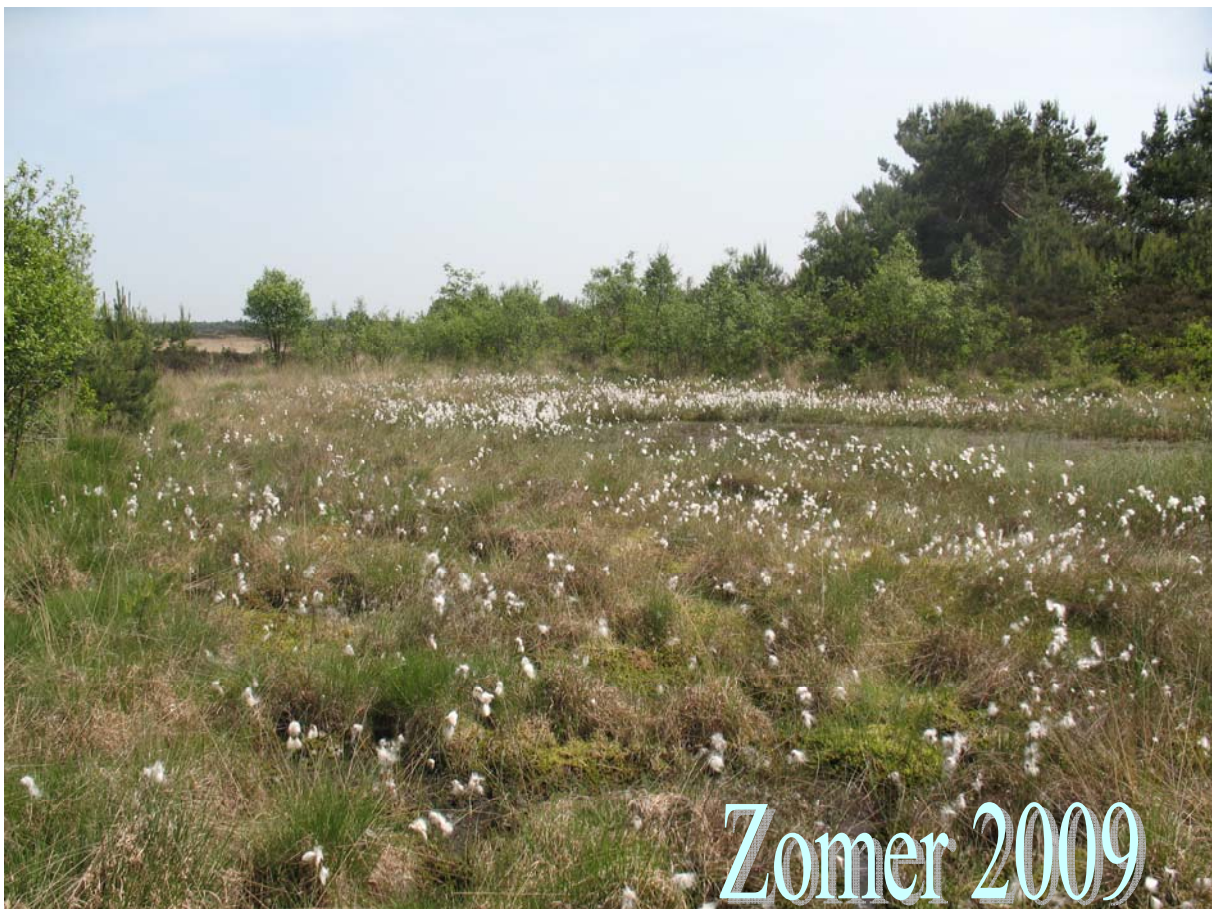
Bloeiend wollegras op de Asselse heide