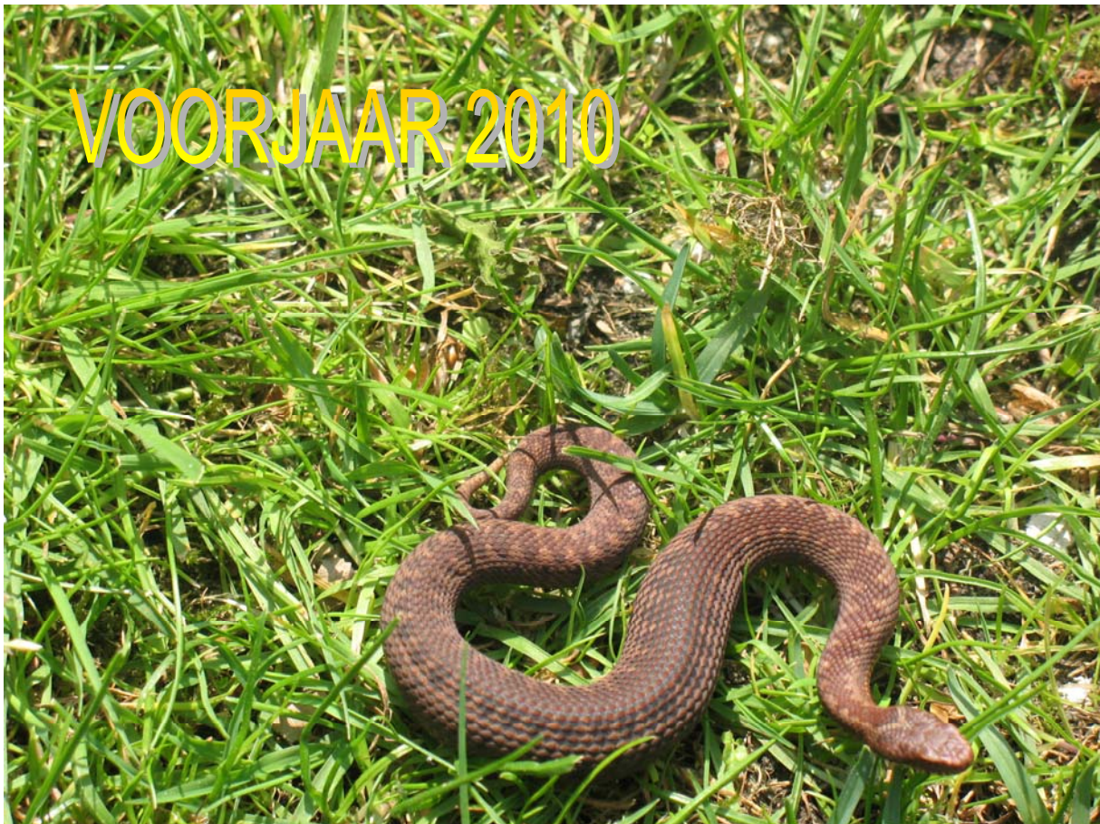
Een echte adder in Assel