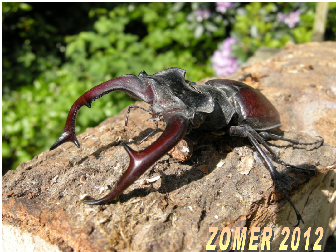
Lucanus Cervus (Vliegend Hert)