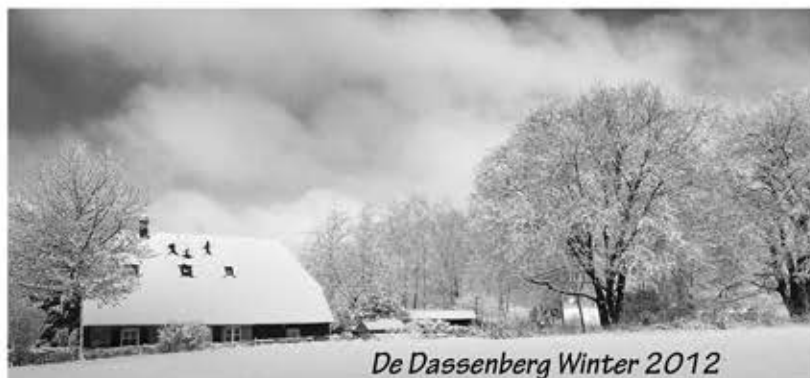
De Dassenberg Winter 2012