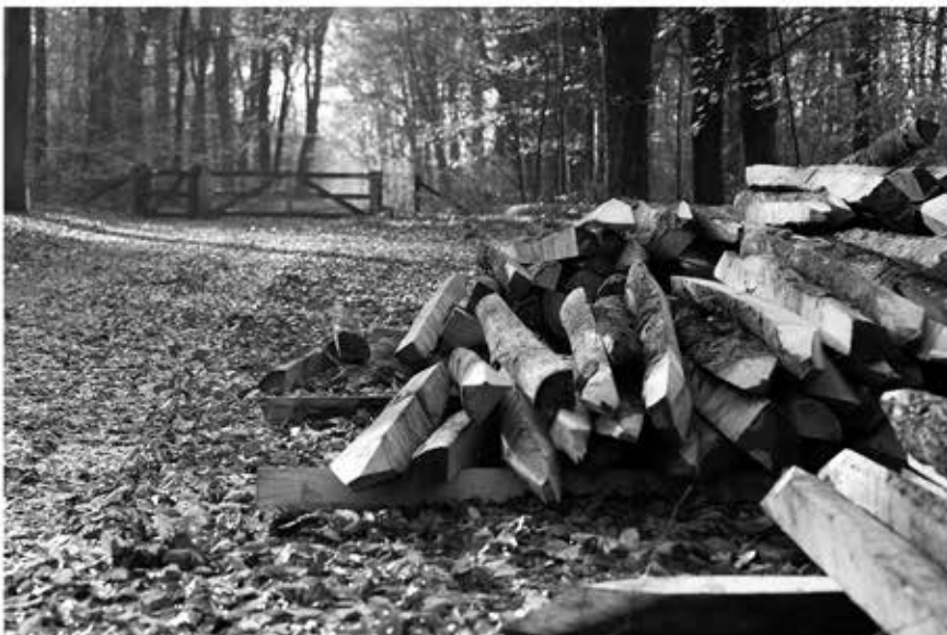
Palen liggen klaar voor een twee meter hoog raster.

Ik zal niet meer hoeven speuren naar hertenprinten langs de Brandtorenweg of naar hun mooie paadjes over de Enk, de herten komen er niet meer in, maar voor de gewassen op de akkers is het veel beter en die zijn ook echt een kenmerk van ons dorp! Om wild te kijken gaan we gewoon naar de hei! Op eerste Kerstdag gaan de hekken weer open en kan iedereen weer fijn op pad. MPV.