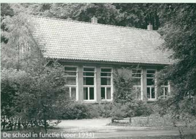
De school in functie (voor 1934)