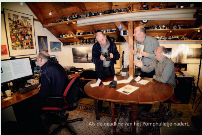
Als de deadline van het Pomphulletje nadert..